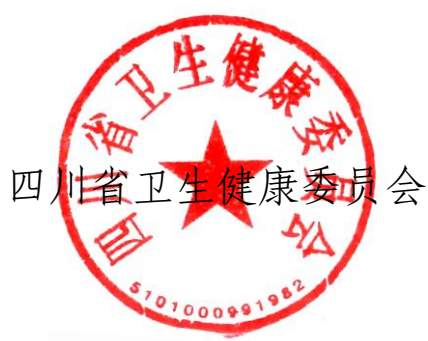
四川省卫生健康委员会