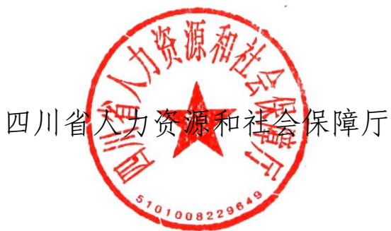
四川省人力资源和社会保障厅

《四川省工伤保险条例》和《〈四川省工伤保险条例〉实施办法》等法规，我们研究制定了《四川省超龄等从业人员参加工伤保险办法》，现印发你们，请遵照执行。