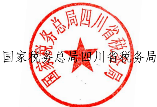
国家税务总局四川省税务局