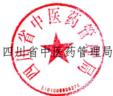
四川省中医药管理局