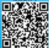
“四川省学生资助” 微信公众号

在高等教育本专科阶段，目前已建立起国家奖学金、国家励志奖学金、国家助学金、国家助学贷款、学费补偿国家助学贷款代偿等多种形式有机结合的高校学生资助政策体系。（如遇国家政策调整，以新政策文件为准执行）