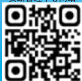
四川省学生 资助管理中心网站