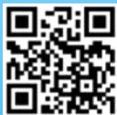
全国学生 资助管理中心网站

开学前后往往是电信、网络诈骗高发期，一些诈骗分子会冒充大学老师、资助机构工作人员等，给新生发短信、打电话、加微信或QQ好友，用各种手段骗取钱财，或发放互联网消费贷款，引诱学生陷入高额贷款陷阱。请你一定擦亮眼睛，提高警惕，抵住诱惑，避免上当。要想了解学生资助政策的更多内容，请关注“中国学生资助”（jybzzzx）、“四川学生资助”微信公众号（scsxszz）和全国学生资助管理中心网站（ http://www.xszz.cee.edu.cn ）、四川省学生资助管理中心网站（ https://www.scsxszz.cn/ ）。