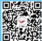
“中国学生资助” 微信公众号